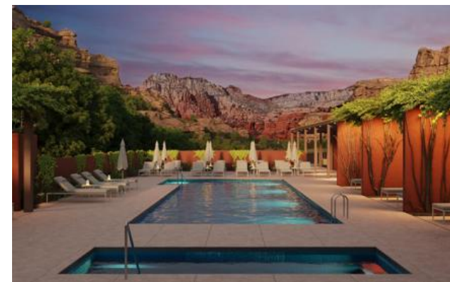
Membro Relais & Châteaux dal 2023 525 Boynton Canyon Road 86336, Sedona

Hotel e ristorante in montagna. Mii amo è un rinomato resort Spa & Wellness non lontano dal Grand Canyon, un'autentica oasi di pace situata tra le splendide rocce rosse del Boynton Canyon, uno dei più potenti vortici di energia spirituale a Sedona, in Arizona. Rientrate in sintonia con la natura e con la vostra essenza in un ambiente incantevole, dove gli spazi sono progettati per migliorare la connessione tra gli ospiti e il canyon. Rivestite con tappeti naturali, legno e coperte artigianali, le camere si aprono su un paesaggio immenso, una distesa punteggiata da fichi d'India e pini del deserto. Tutte quante dispongono di caminetti interni e patii privati. Apprezzato per il suo approccio olistico senza eguali, Mii amo offre soggiorni all-inclusive e personalizzati, compresi trattamenti su misura e meditazioni guidate ad opera di professionisti intuitivi ed esperti. Così connessi l'una all'altro, mente e corpo potranno gustare pienamente i sapori immaginati dallo Chef del ristorante Hummingbird, che predilige una cucina basata su ingredienti e prodotti locali.